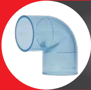
TRANSPARENT FITTING ELBOW 90° (D)