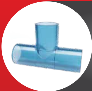
TRANSPARENT FITTING TEE (AW)