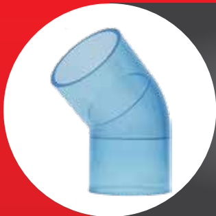
TRANSPARENT FITTING ELBOW 45° (D)