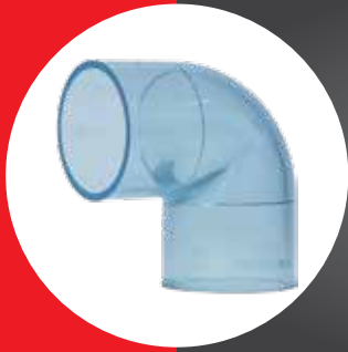
TRANSPARENT FITTING ELBOW 90° (AW)